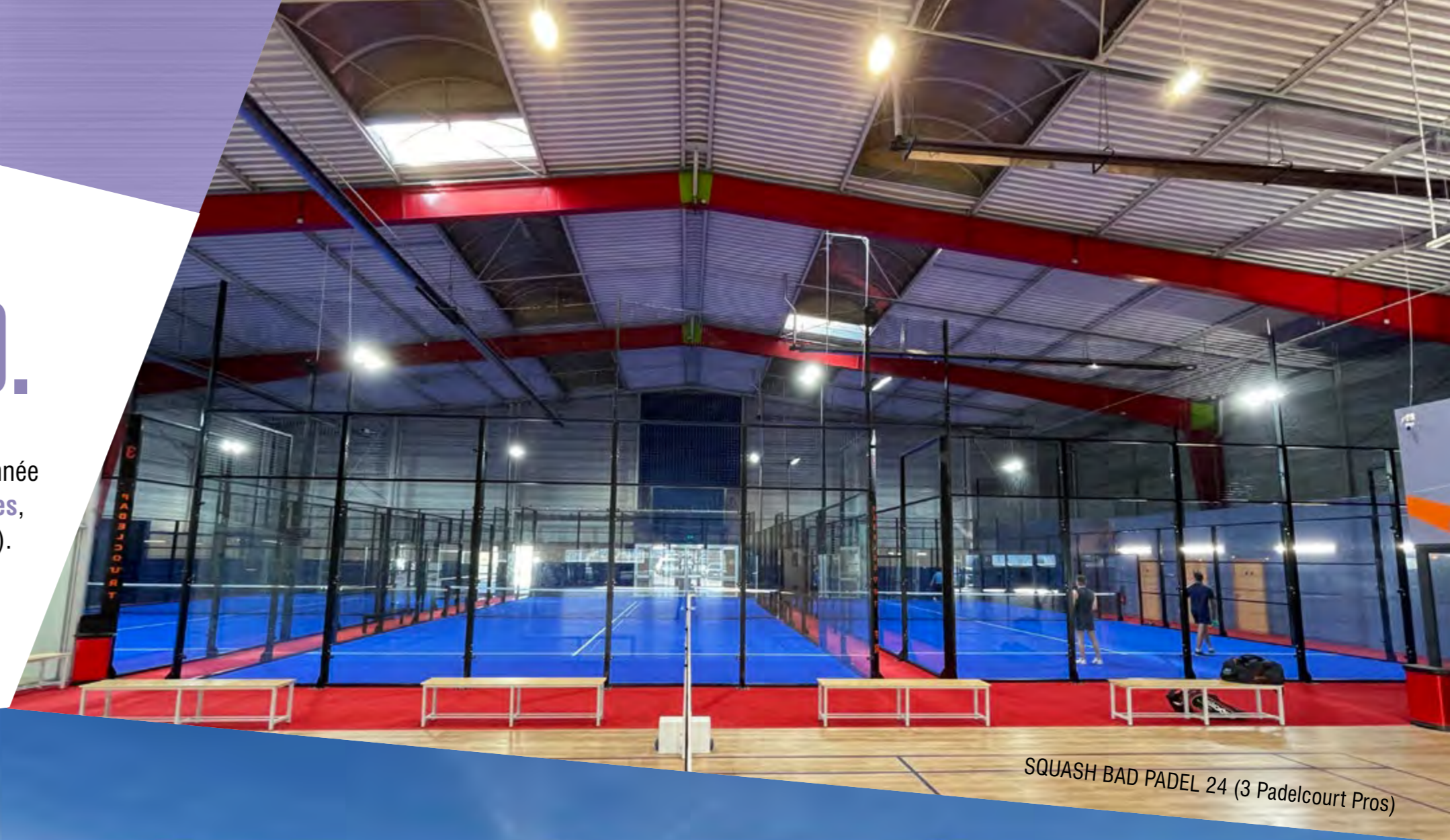
SQUASH BAD PADEL 24 (3 Padelcourt Pros)

En ossature aluminium ou bois et avec une couverture en dur ou en toile au choix elles permettent de jouer toute l'année dans les meilleures conditions .