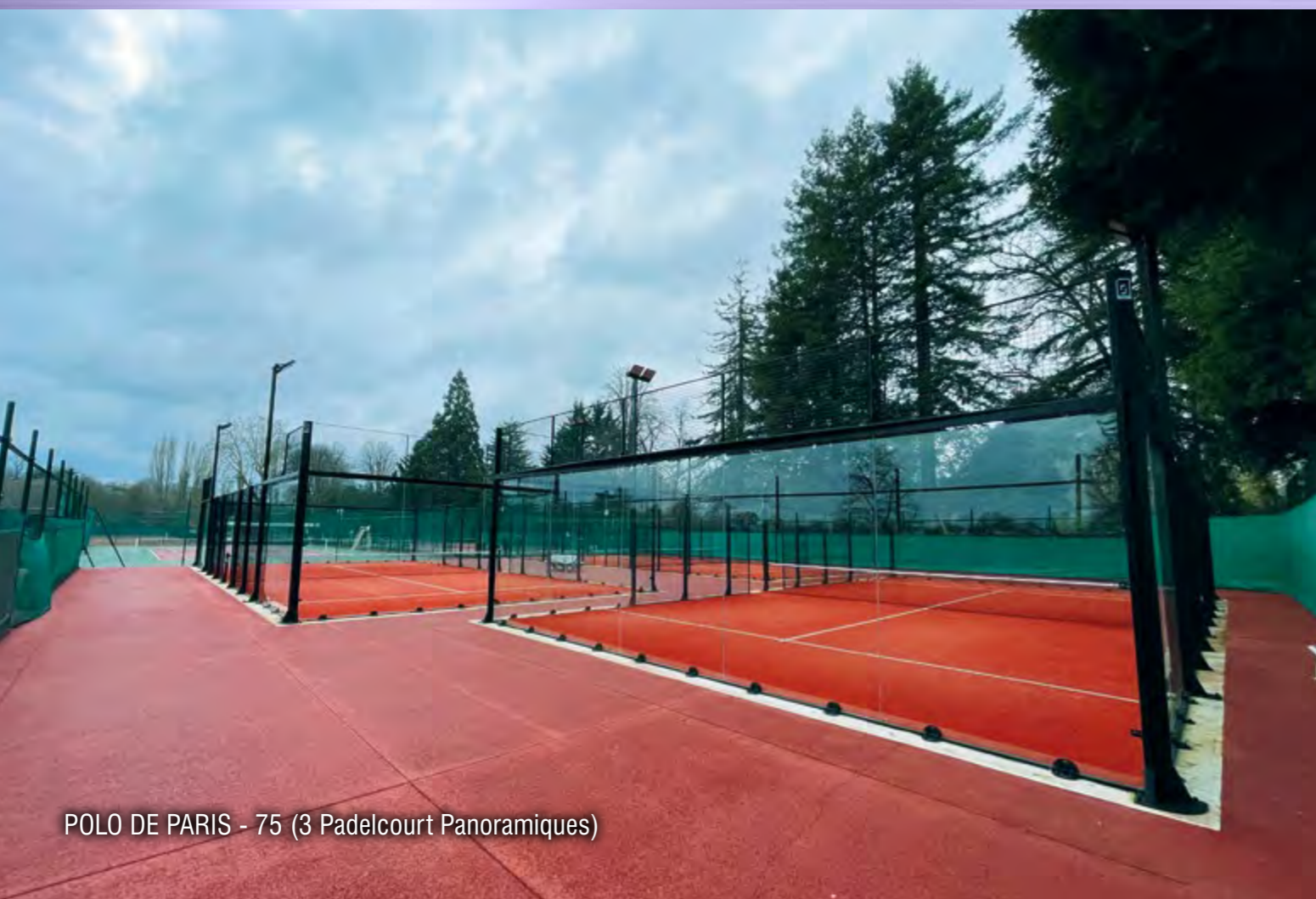
POLO DE PARIS - 75 (3 Padelcourt Panoramiques)