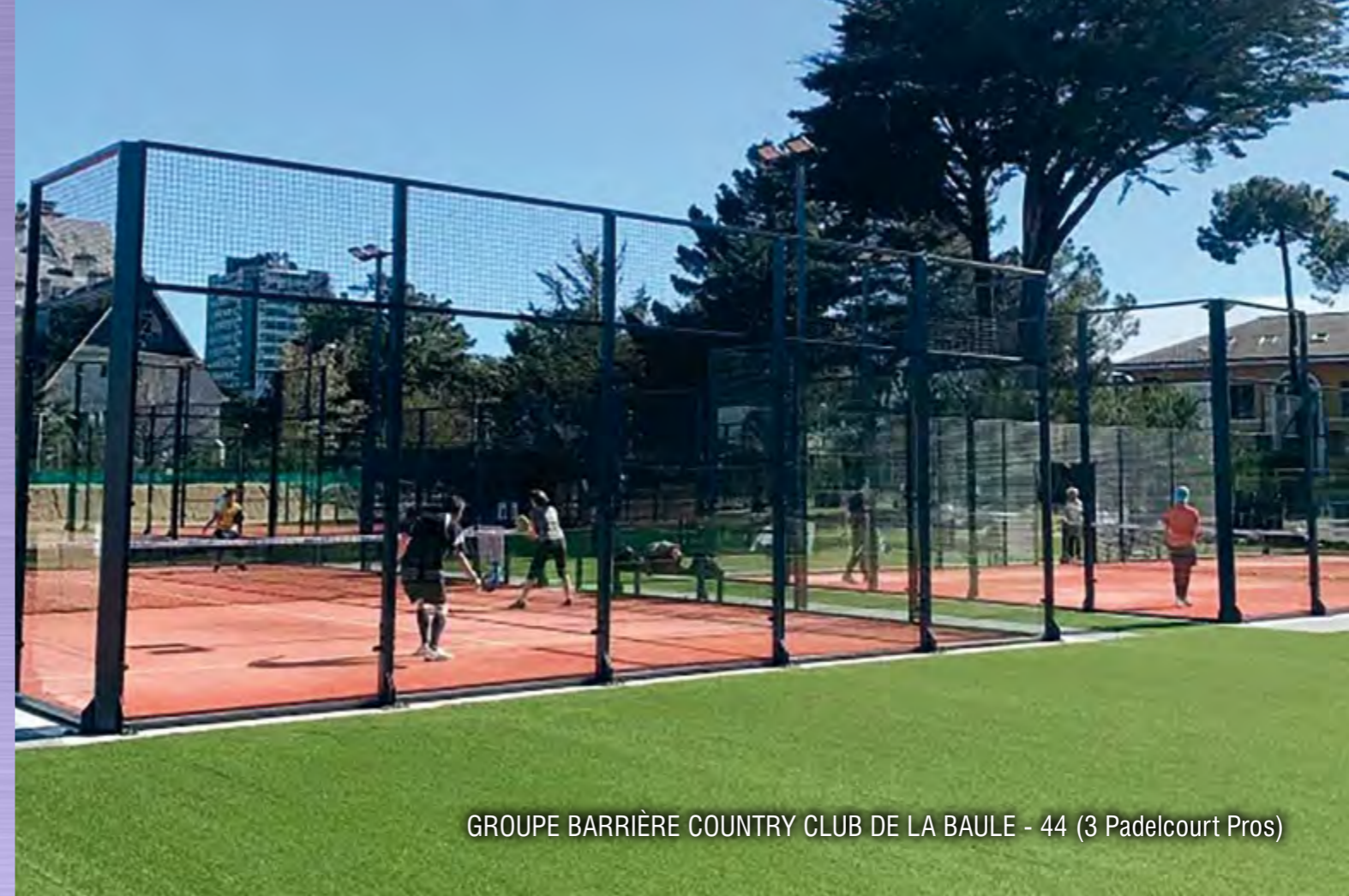
GROUPE BARRIÈRE COUNTRY CLUB DE LA BAULE - 44 (3 Padelcourt Pros)