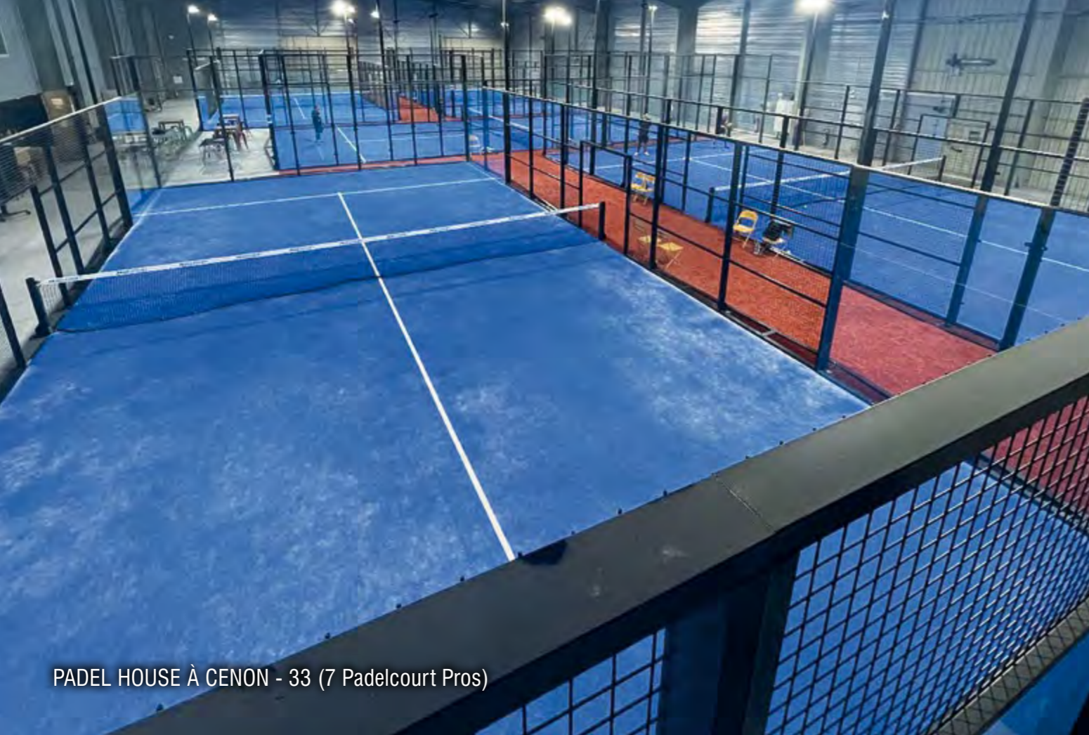
PADEL HOUSE À CENON - 33 (7 Padelcourt Pros)