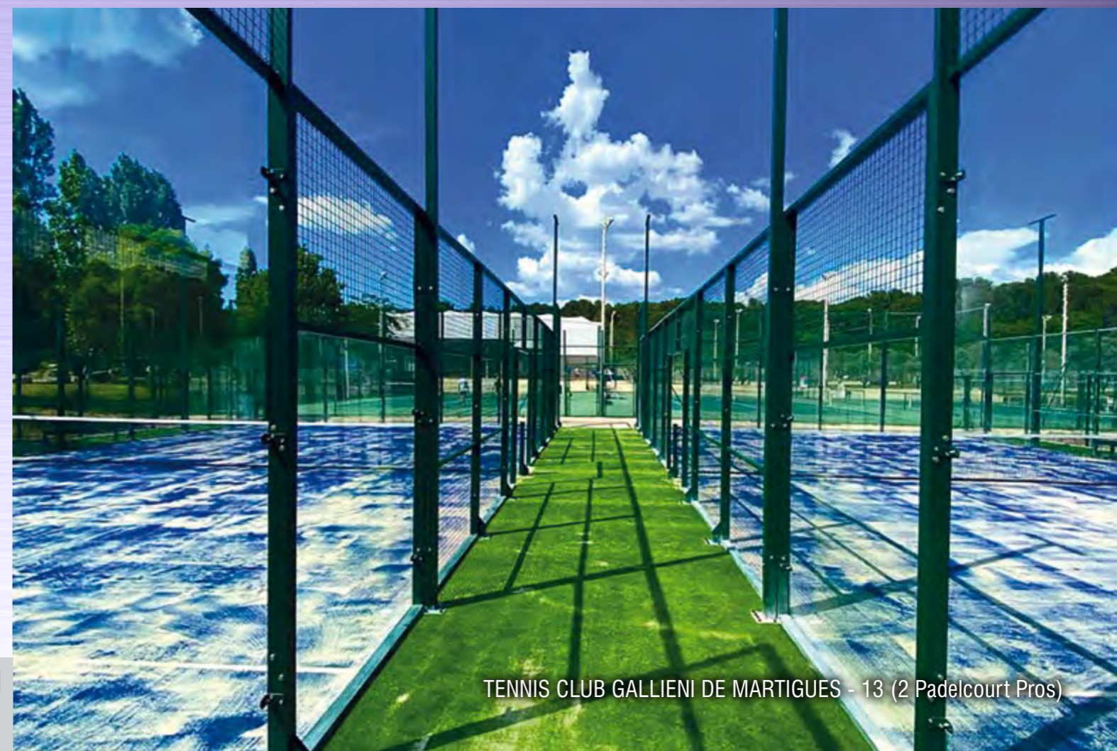
TENNIS CLUB GALLIENI DE MARTIGUES - 13 (2 Padelcourt Pros)