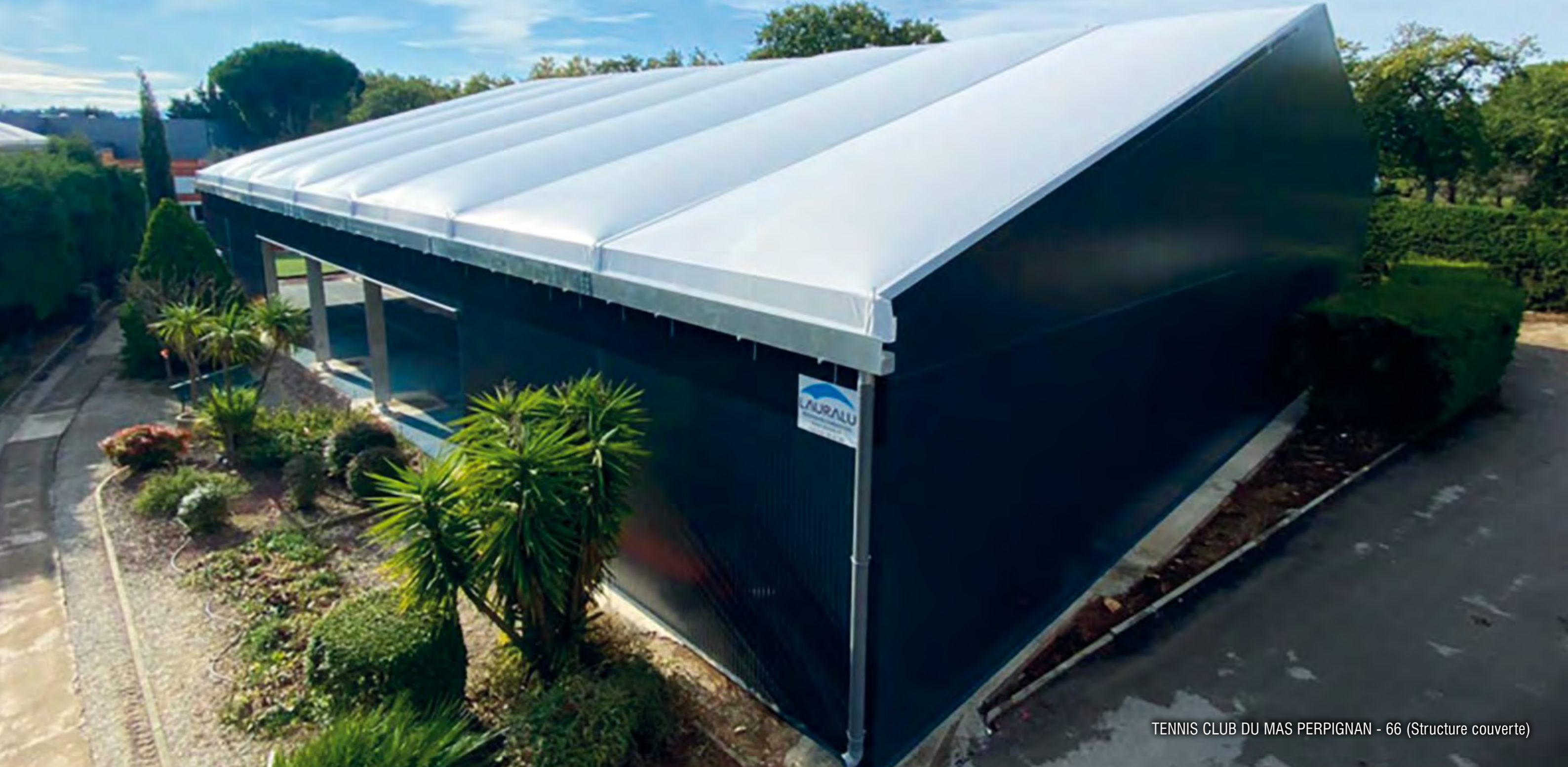
TENNIS CLUB DU MAS PERPIGNAN - 66 (Structure couverte)