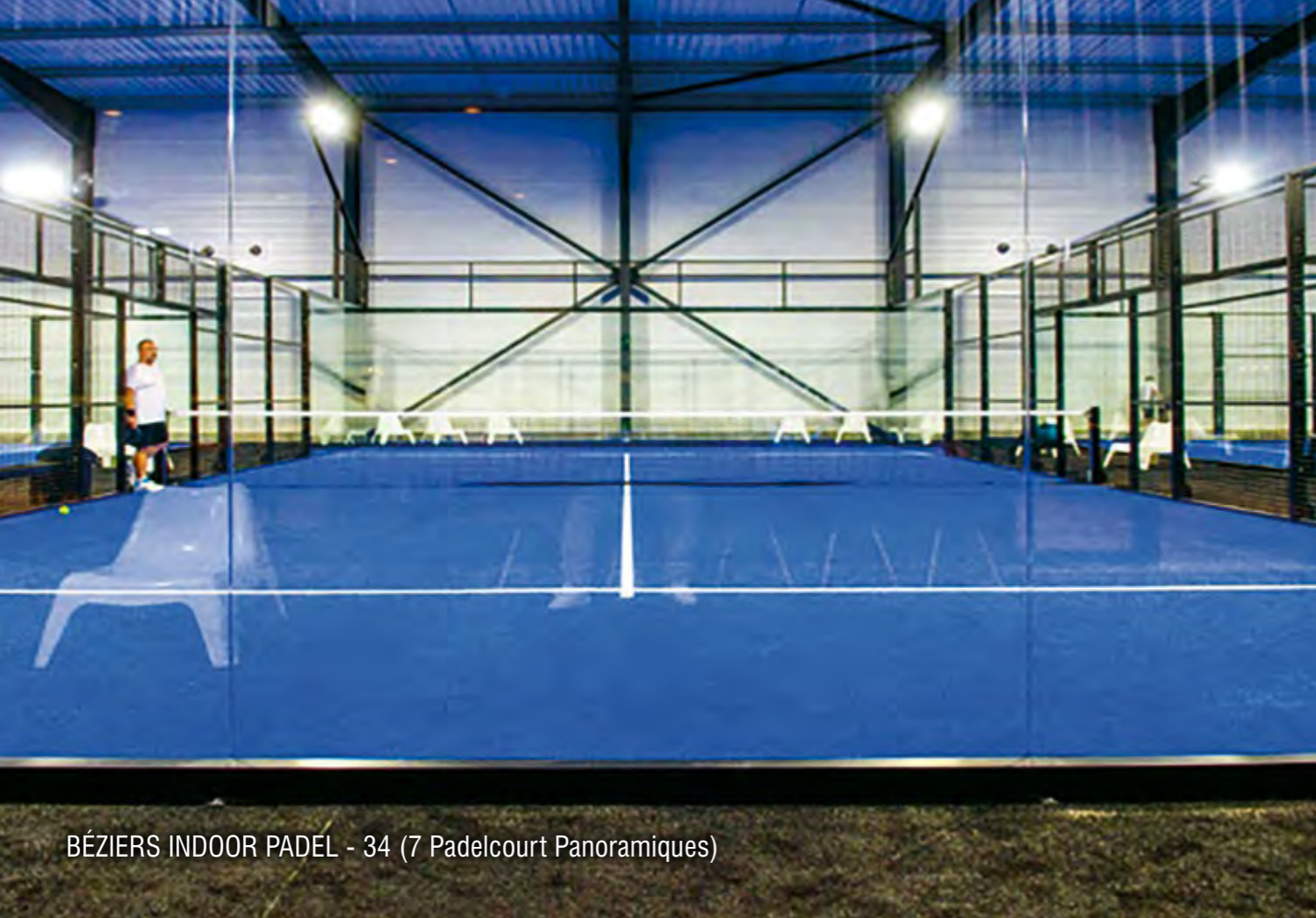
BÉZIERS INDOOR PADEL - 34 (7 Padelcourt Panoramiques)