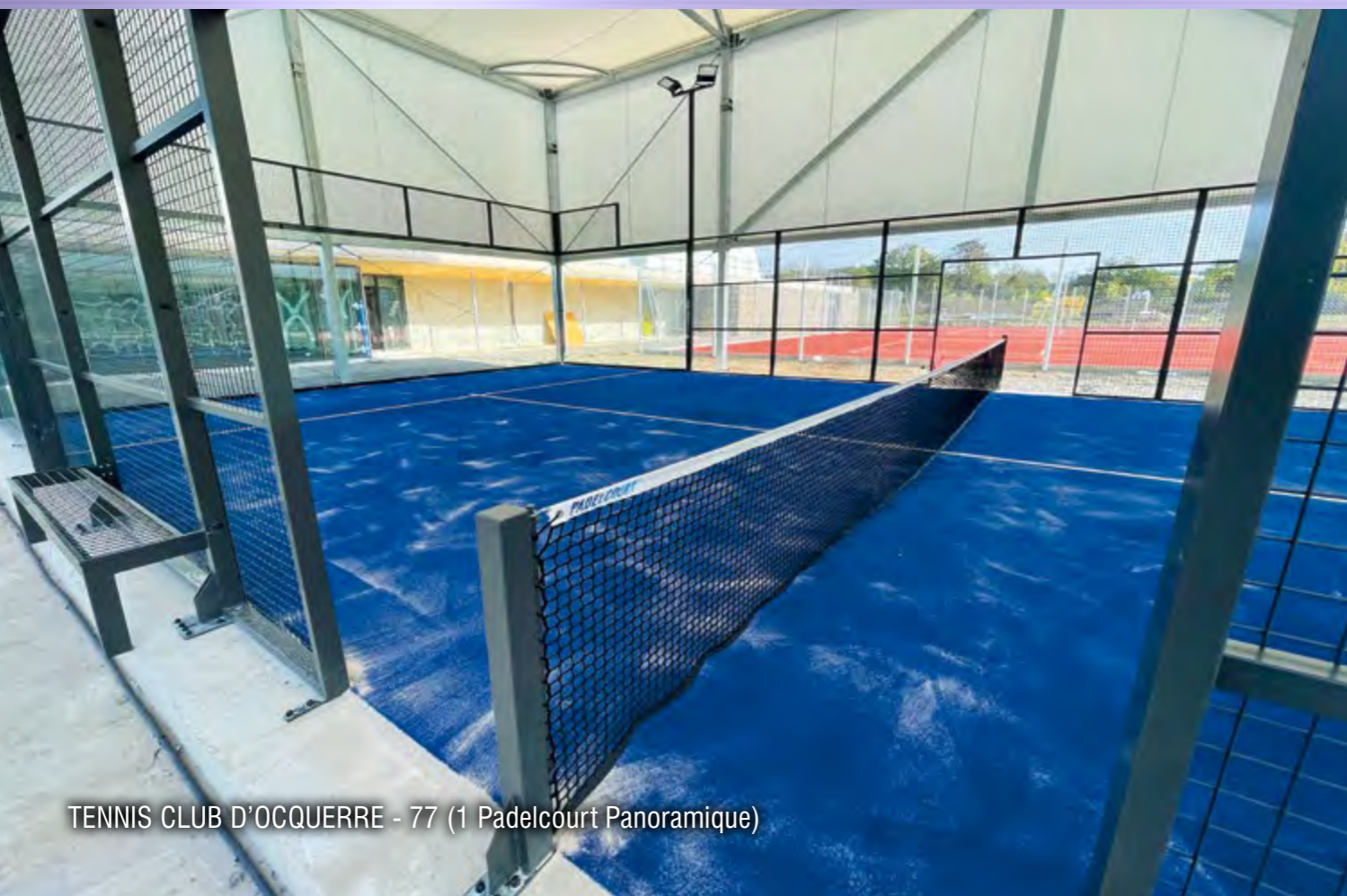
TENNIS CLUB D'OCQUERRE - 77 (1 Padelcourt Panoramique)